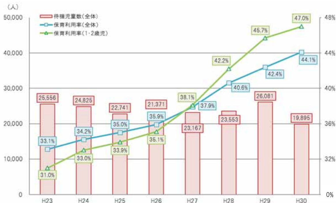
[表 1] 保育所等の利用定員・利用児童数等の状況